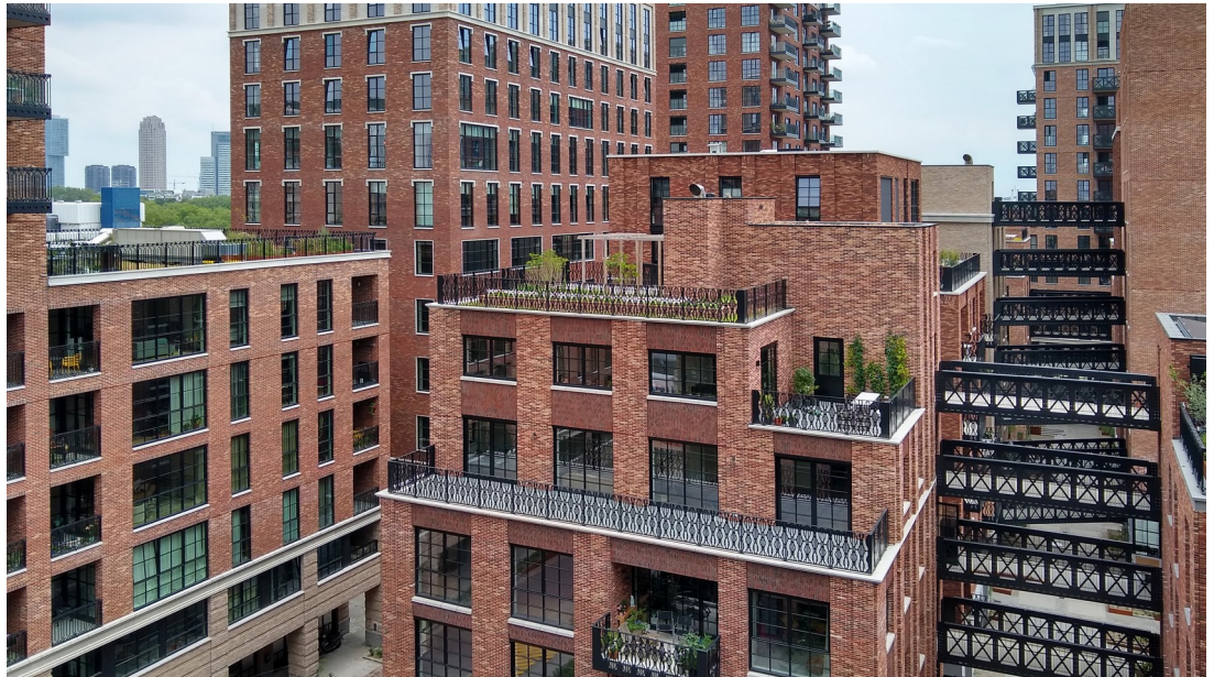
Little C aan de Coolhaven: de koppeling van elk drie torens door stalen loopbruggen.

Gastvrijheid is het oeroude recht van de vreemde op onderdak. Je klopt ergens aan, je treedt binnen en je bent veilig voor de nacht. Naast dit recht, schrijft filosoof Jacques Derrida in De l'hospitalité , gaan er met gastvrijheid ook verplichtingen gepaard. 1 Welke mogelijkheden zijn er om 'gastvrijheid' in de huidige, binnenstedelijke woningbouw vorm te geven? Je kunt denken aan ruimten die voor niet-bewoners toegankelijk zijn of aan gebieden waarin informele ontmoetingen kunnen plaatsvinden. Het gaat dan om zones tussen publiek, gezamenlijk en privé in: het spreekwoordelijke stoepje voor de entree deur. Je kunt ook analyseren of het binnentreden uitnodigend is. Derrida schreef trouwens dat gastvrijheid alleen werkt als drempels en grenzen precies zijn vastgelegd.