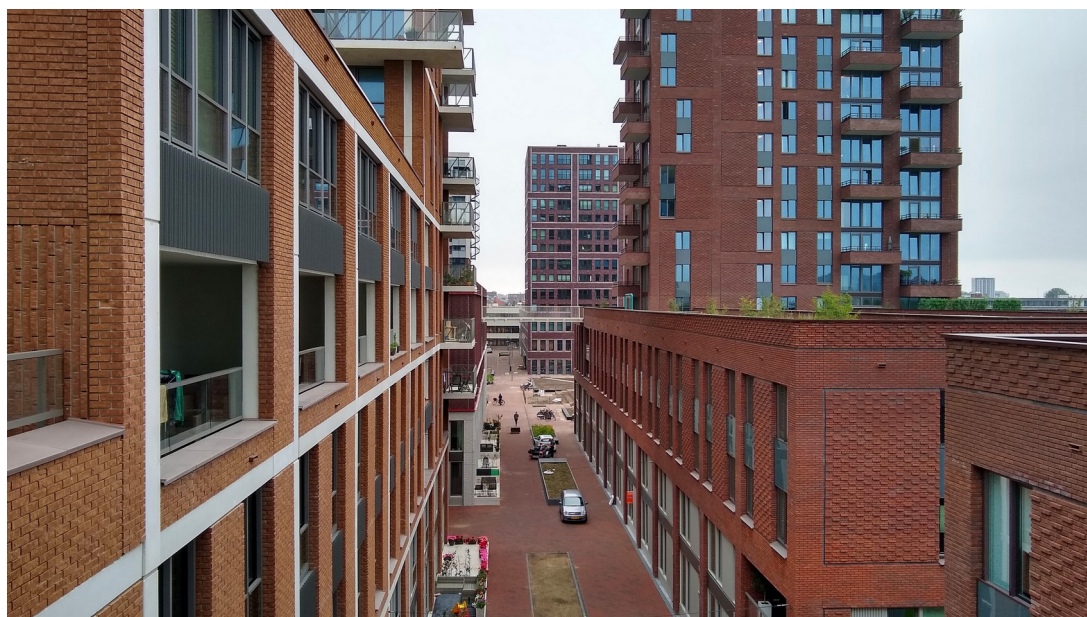
De Groene Kaap op Katendrecht: binnenstraat.

De twee binnenstraten, die het superblok in vieren delen, zijn openbare ruimten. Alle binnenhoven zijn semi-collectief: de privéterrassen gaan over in gezamenlijk gebruikte ruimte. Hoogte- en materiaalverschillen verduidelijken de grens tussen openbaar, gezamenlijk en privé. Alle groene gebieden zijn ontworpen door LOLA landscape architects, met de voor dit bureau gebruikelijke knipoog. Een turquoise buis die zich als een slang door het binnengebied windt en waarop enkele zitjes zijn gemonteerd, houdt bezoekers bij de les opdat zij niet langs de privéranden dwalen. Insecten en vogels zullen hun gang gaan in boomstronken en nestelplaatsen. Gastvrijheid ook voor de fauna.